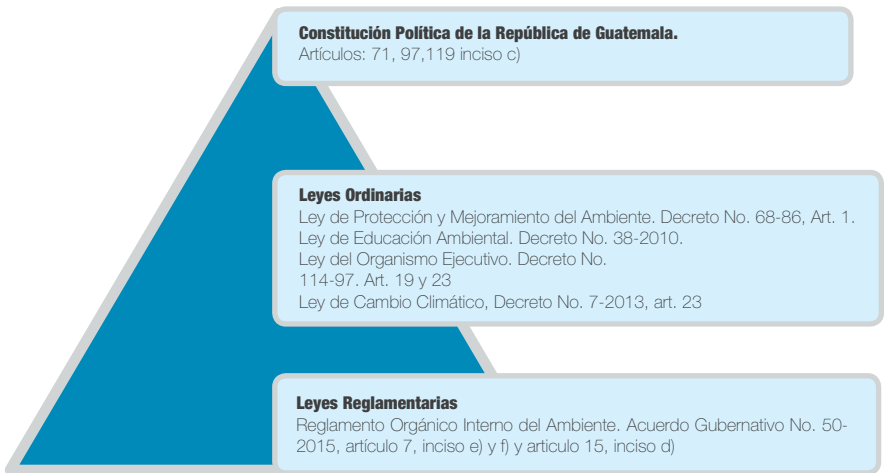
Figura 1. Pirámide Jurídica de la Educación Ambiental en Guatemala